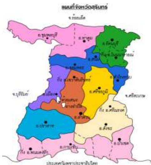
ภาพที่ 2 แผนที่จังหวัดสุรินทร์